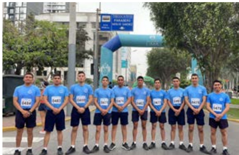
Cadetes prestos ayudar y ser partícipes de labores sociales a favor de la comunidad

Los cadetes, prestos a las actividades sociales con un fin que busca el mejoramiento del individuo y del país, asistieron a esta campaña social deportiva que tuvo como punto de partida el parque Washington.